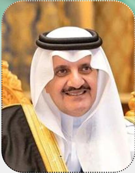
أمير المنطقة الشرقية صاحب السمو الملكي الأمير سعود بن نايف بن عبد العزيز آل سعود