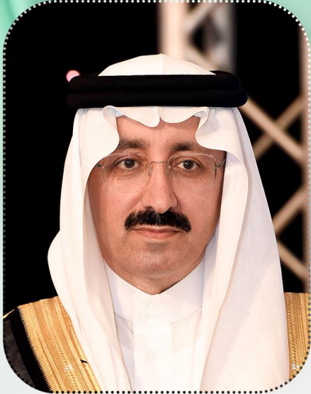
محافظ الأحساء صاحب السمو الأمير بدر بن محمد بن جلوي آل سعود