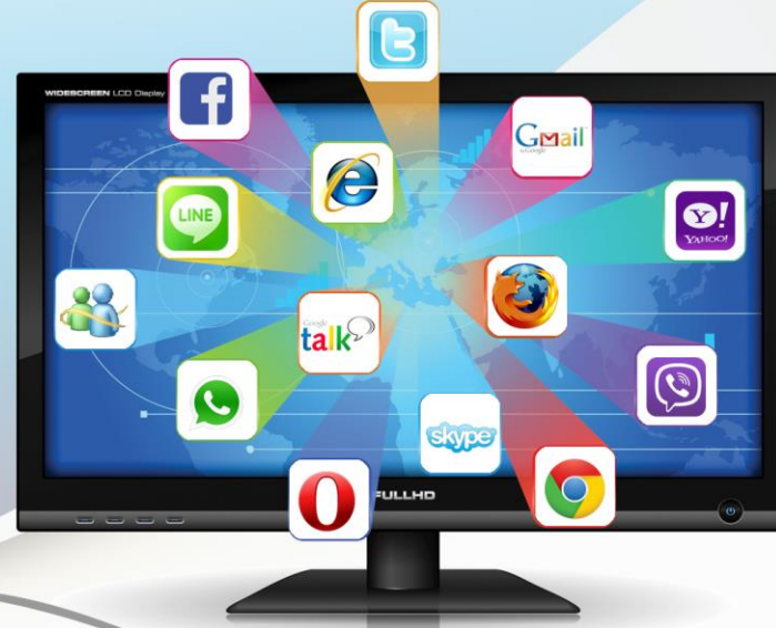
أدوات عمل البرنامج