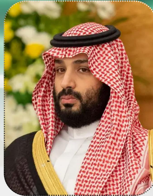
ولي العهد صاحب السمو الملكي الأمير محمد بن سلمان بن عبد العزيز آل سعود