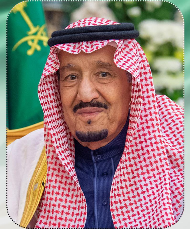
خادم الحرمين الشريفين الملك سلمان بن عبد العزيز آل سعود